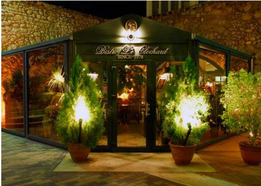
Restaurant “Le Clochard “